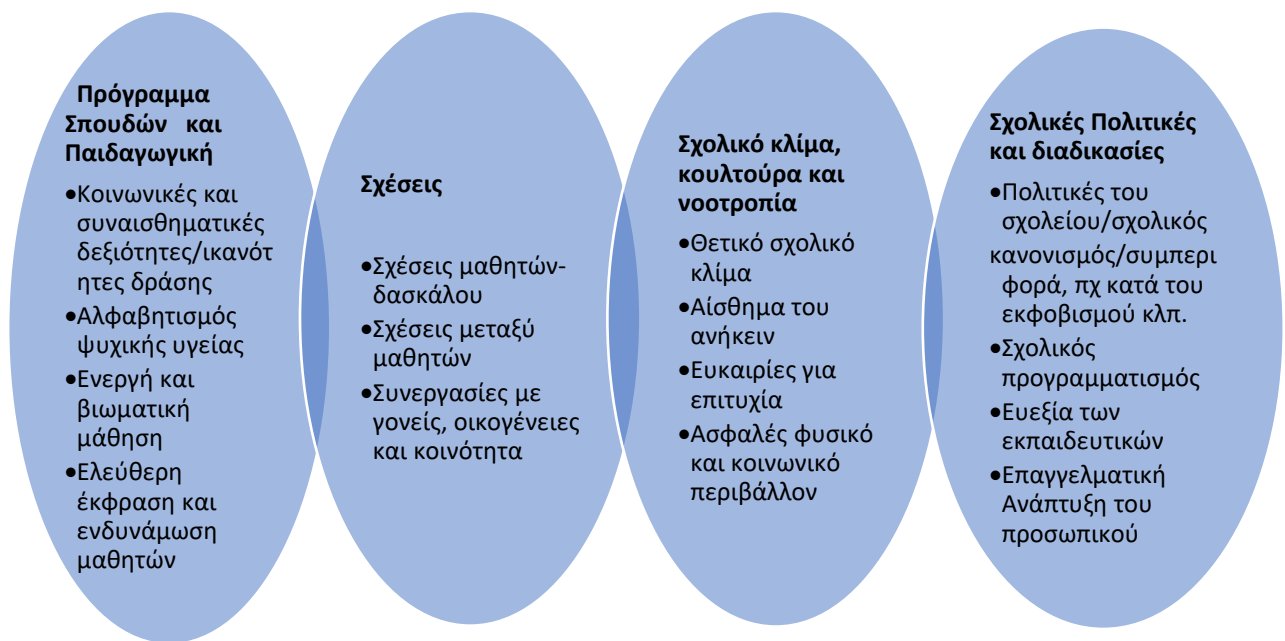
Σχήμα 2. Χαρακτηριστικά των επιτυχημένων πρωτοβουλιών ολιστικής προαγωγής της ψυχικής υγείας σε σχολικά περιβάλλοντα